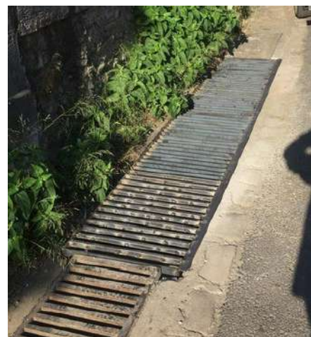
Remplacement de grilles pour protection caniveau avenue des orangers