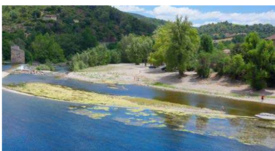
La plage avant