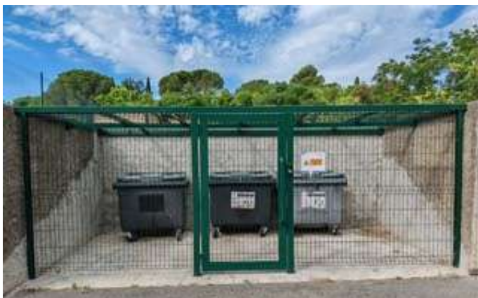
Camping campotel Fermeture du local des poubelles