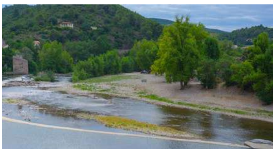
La plage après le nettoyage