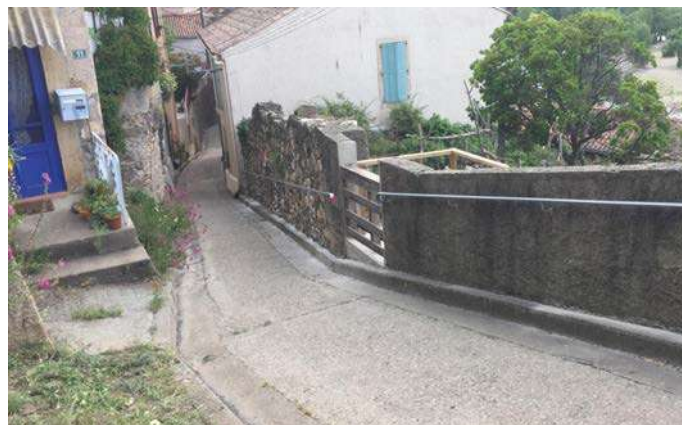
Installation d'une rampe rue de Roquegrosse