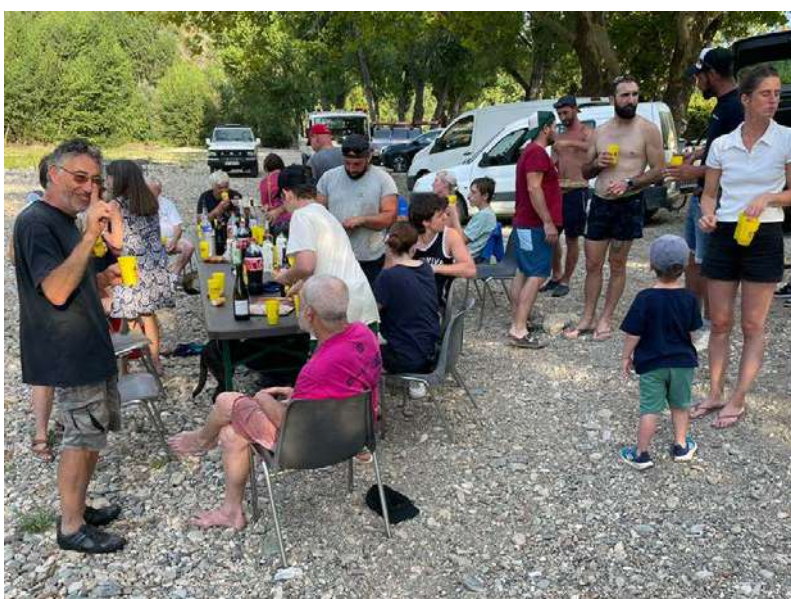
Les bénévoles se réunissent pour un apéritif convivial après leur travail