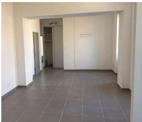
Rénovation appartement municipal avenue des orangers